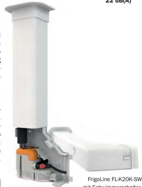
FriGoLine FL-K20K-SW mit Schwimmerschalter.