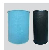
Glasfaser + HEPA-Filter. Aktivkohlefilter. Das Filterset kann auch als Ersatzteil bestellt werden: (AFR-AIRPUR-360 5250010700)